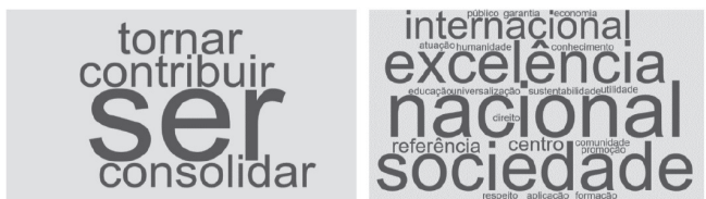
Fonte: Dados da pesquisa (2019)

Os objetivos para o futuro definidos na visão são focados no verbo Ser. As universidades direcionam suas ações para serem reconhecidas nacional e internacionalmente como instituições de excelência, ou se consolidarem como tal. Destacam-se ainda os objetivos voltados à sociedade. O processo de construção da visão, com foco no futuro, evidencia a necessidade de se considerar a estratégia como algo dinâmico, em constante evolução e articulado com o ambiente no qual está inserida, ou seja, a sociedade, e para onde se destinam suas ações. Verificou-se na pesquisa que três universidades (UFJF, UFMG e UFSJ) não apresentam a visão da instituição para o futuro em seu plano de desenvolvimento.